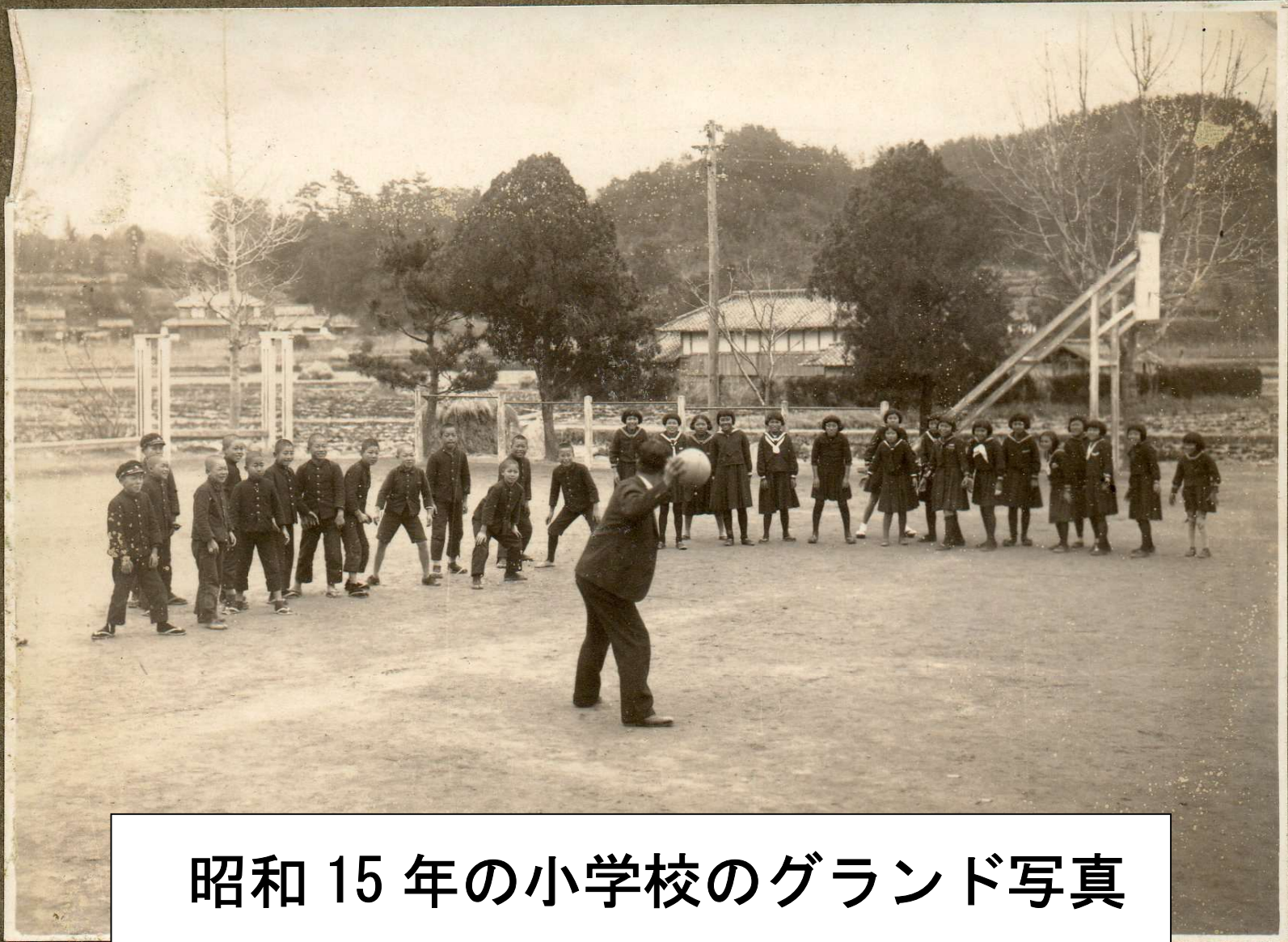
昭和 15 年の小学校のグラウンド写真