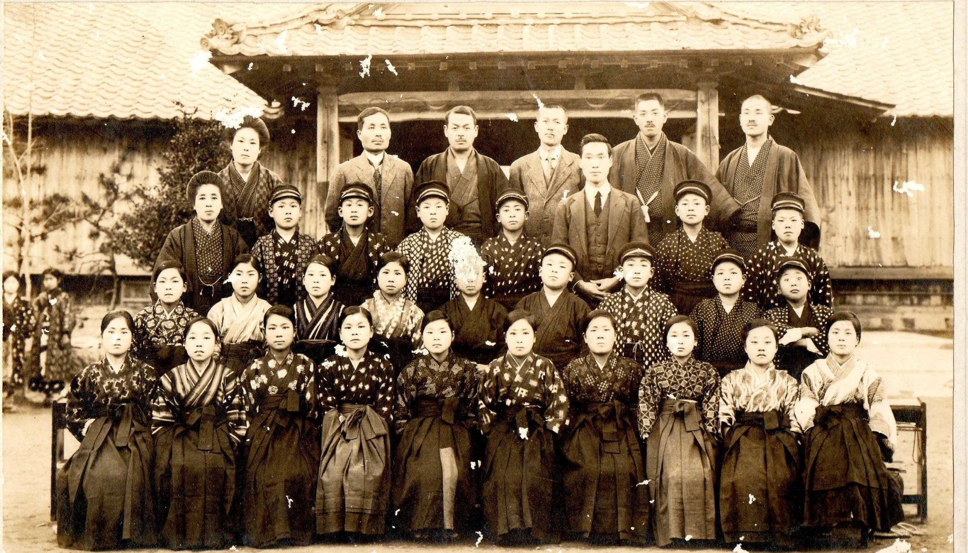
大正 13 年頃の小学校卒業写真