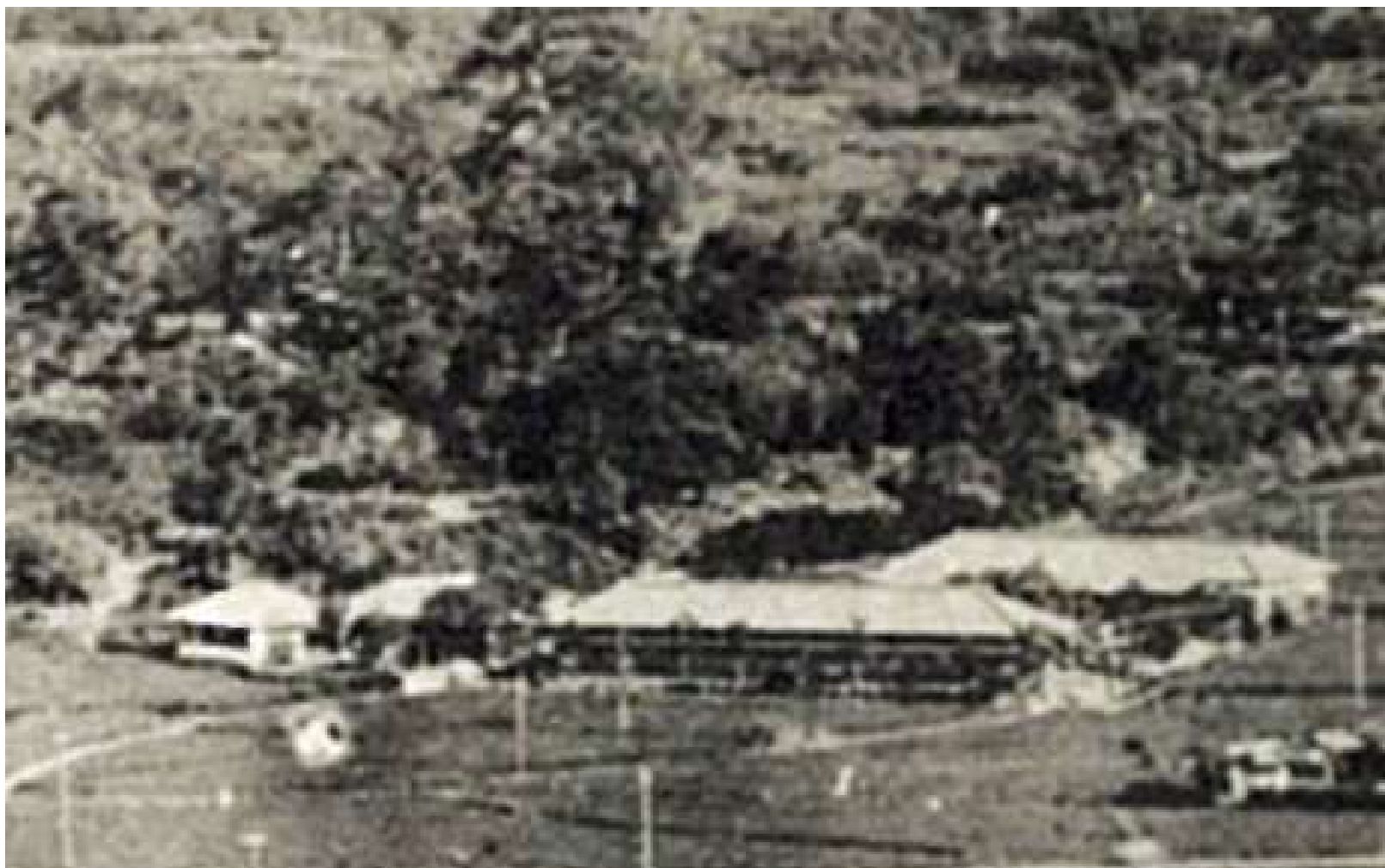
大正十四年発行冊子の写真より學校部分を切抜き