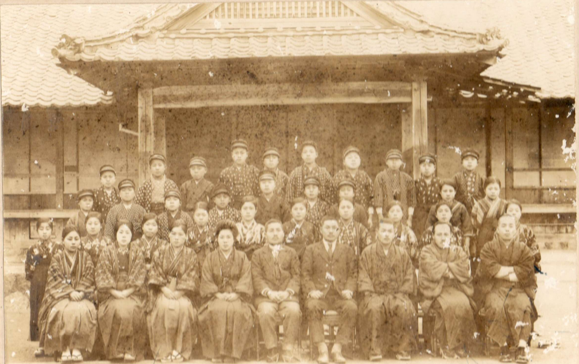
昭和元年の小学校卒業写真