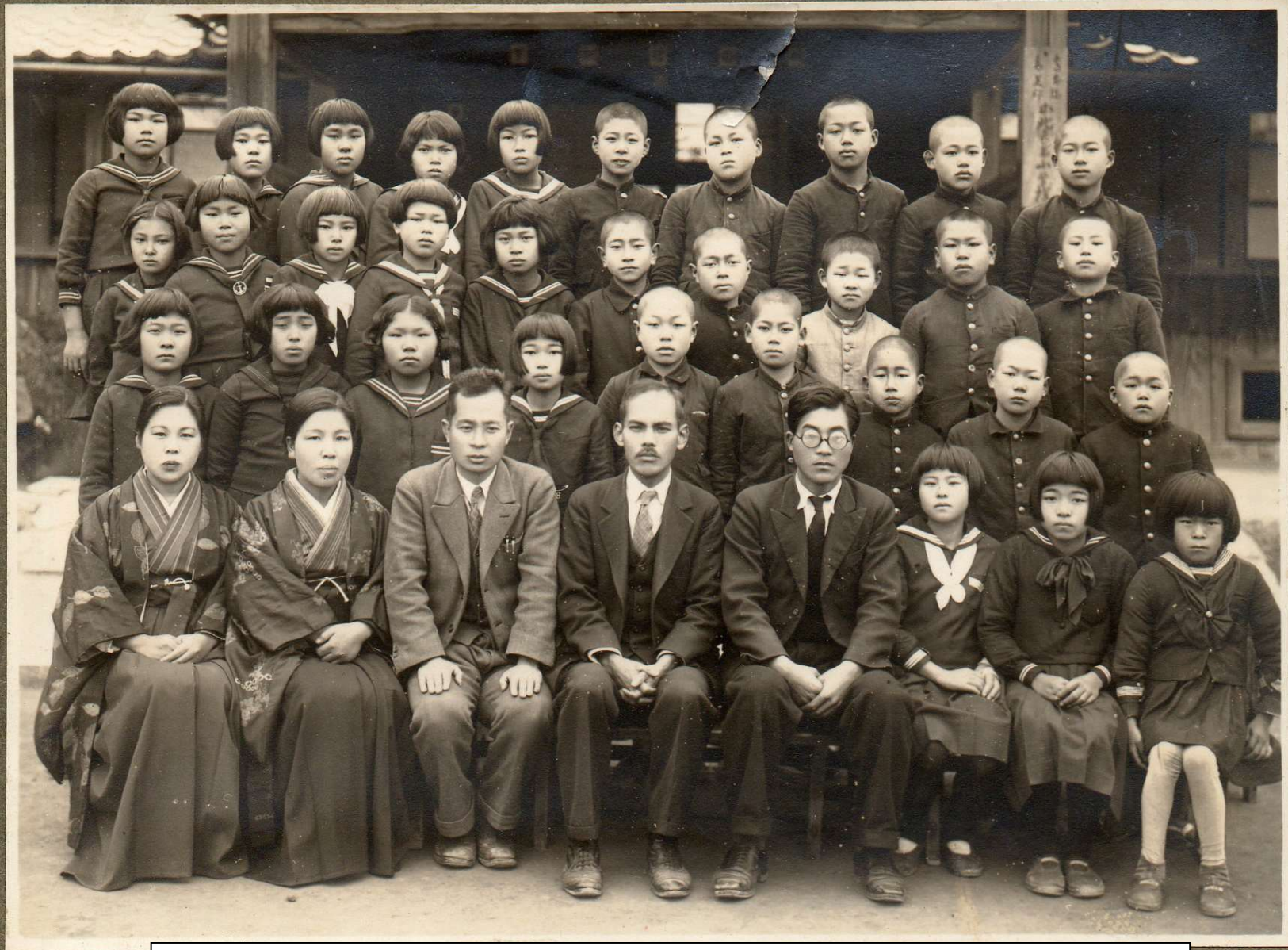
昭和 15 年の小学校卒業写真