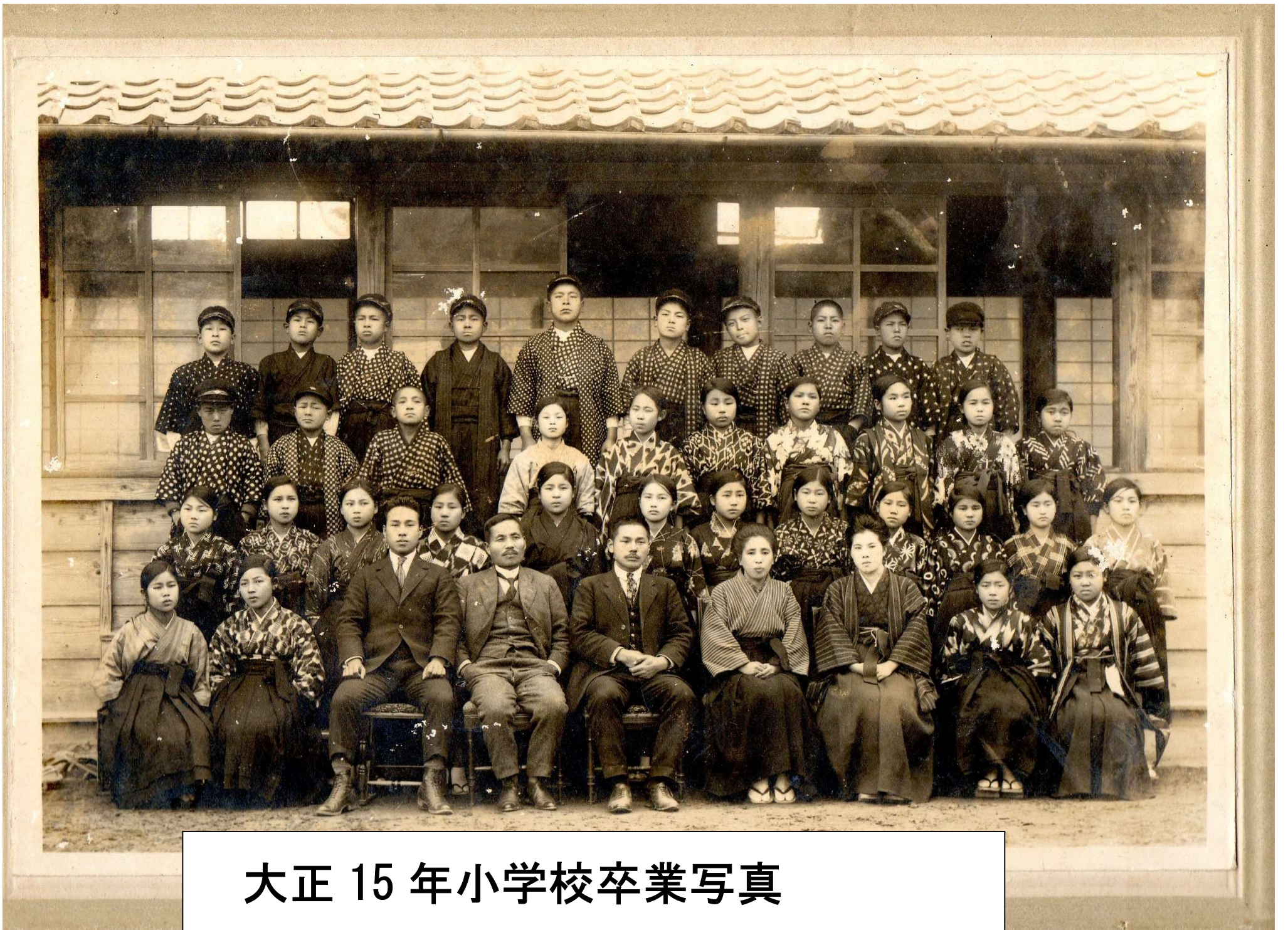
大正 15 年小学校卒業写真