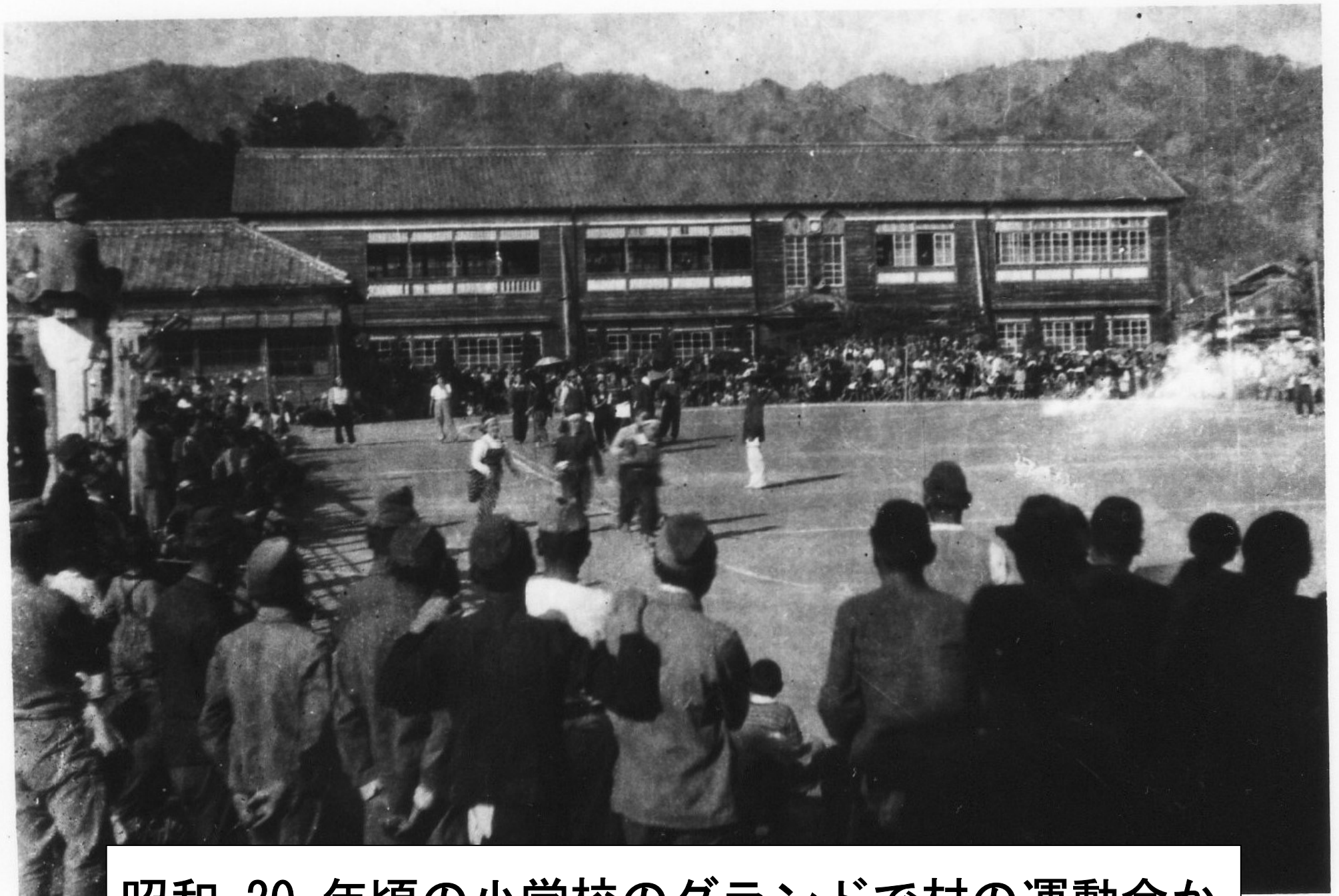
昭和 20 年頃の小学校のグラウンドで村の運動会か