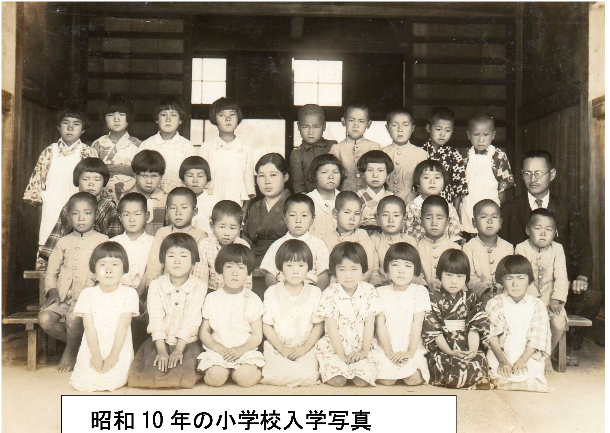
昭和 10 年の小学校入学写真